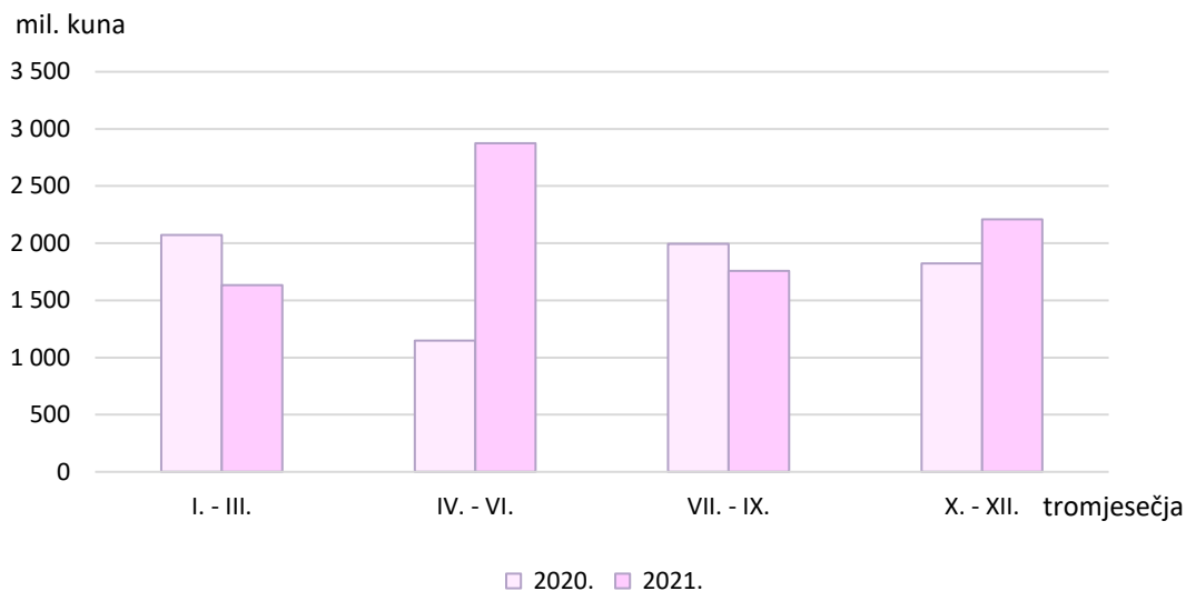
G 1. VRIJEDNOST NOVIH NARUDŽBI GRAĐEVINSKIH RADOVA PO TROMJESEČJIMA 2020. I 2021.

U odnosu na isti mjesec 2020., u četvrtom kvartalu 2021. zabilježen je porast vrijednosti novih narudžaba u svim mjesecima, a najveći porast zabilježen je u prosincu za 30,0%.